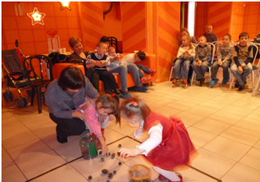
Праздник в минигруппе «Осень в гости к нам пришла».