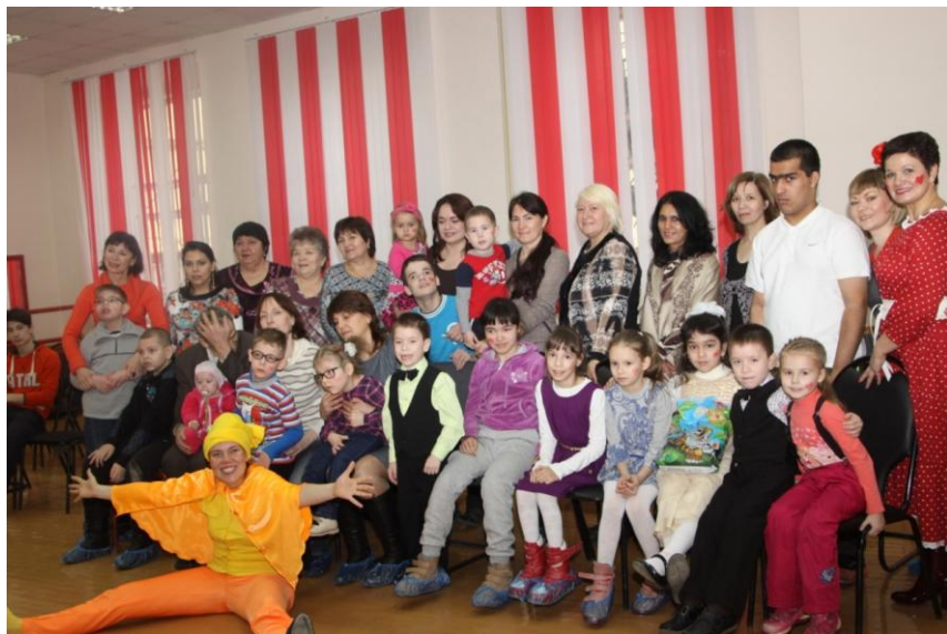
Праздник, посвященный декаде инвалидов.