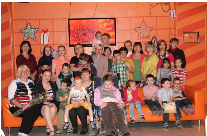
Награждение за творческие достижения.