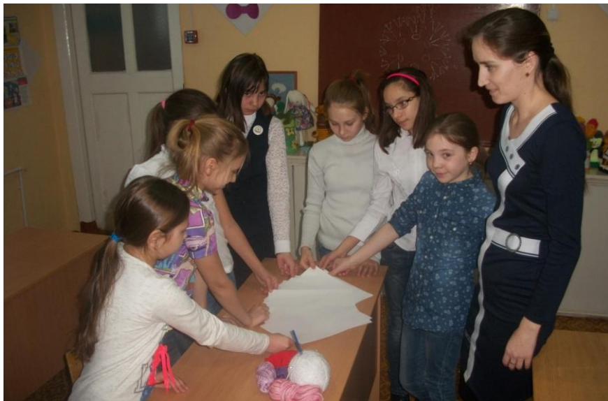
Конкурсно-игровая программа «Модная академия»