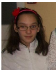
Фото о практической работе с детьми с ОВЗ: