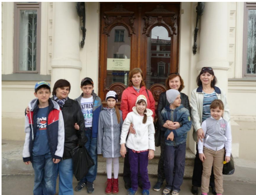
Мы в музее.